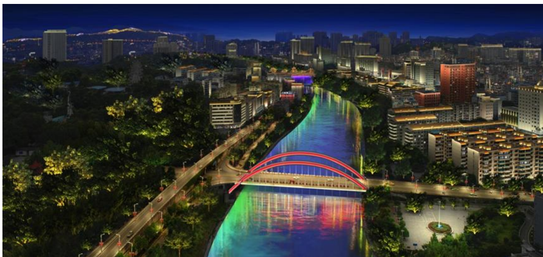
恩施市清江流域美化亮化工程

报告期内，子公司清华康利承接了恩施市清江流域美化亮化工程，项目总金额约 5.1 亿元，分三期建设，其中第一期项目已签订合同金额 1.84 亿元，回款周期为 1 年左右。此外，公司参与了深圳市改革开放四十周年灯光秀的设计和部分项目的施工、青岛多个城区的楼宇和绿地及山区亮化，以及区域重点城市的规划、设计及施工服务。