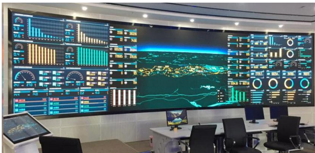
福建省数字永泰运营中心

在如火如荼的智慧城市建设和热潮中，LED 可视化解决方案在城市运营中心、智慧政务、平安城市等多种场景的应用上发挥着至关重要的作用。2018 年 8 月，公司携手华为、软通等智慧城市生态圈合作伙伴亮相“2018 中国智慧城市国际博览会”，深度助力新型智慧城市整体规划与建设。报告期内，公司已与合作伙伴在全国多地完成了智慧城市项目的落地，包括深圳市福田区智慧城市运营中心、中电深圳智慧城市运营中心等全国性的标杆项目，以及福建省数字永泰运营中心、大连市智慧城市运营管理中心、榆林市智慧城管运营指挥中心等十余个地方重点项目。随着智慧城市的建设在全国市县一级迅速铺开，城市运行核心系统关键数据的可视化需求将成为城市管理的刚性需求，公司将联合合作伙伴，为智慧城市指挥、监控、调度中心提供一流的整体显示解决方案。