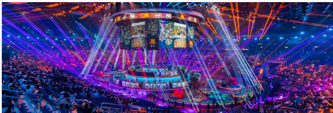
2018年PGI绝地求生全球邀请赛