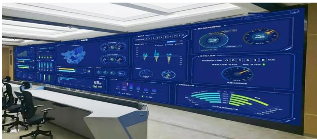
国家电投集团广西电力有限公司南宁生产运营中心