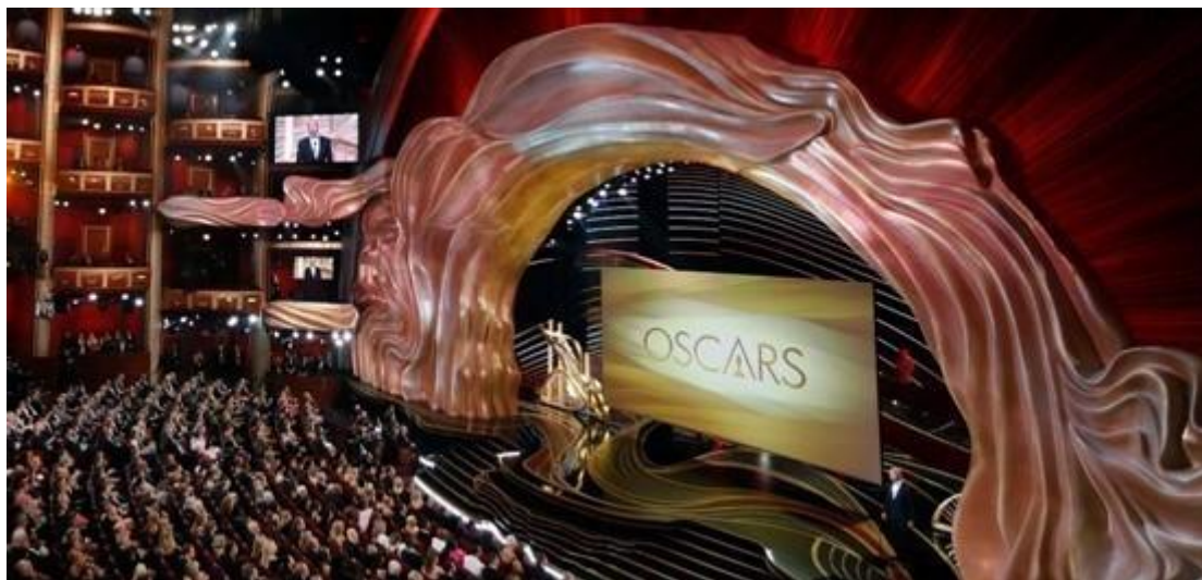
2019年奥斯卡颁奖典礼项目

在体育显示领域，通过在行业内多年的人才储备、技术积累和市场拓展，“洲明体育”品牌影响力享誉全球。目前公司已配有专业的体育研发团队、市场调研团队、解决方案团队及售后支持团队，并为客户提供精准匹配符合各应用场馆及客户需求的体育应用解决方案。报告期内，公司助力 2020 年欧洲杯预选赛，为其提供专业的体育显示应用产品及解决方案。