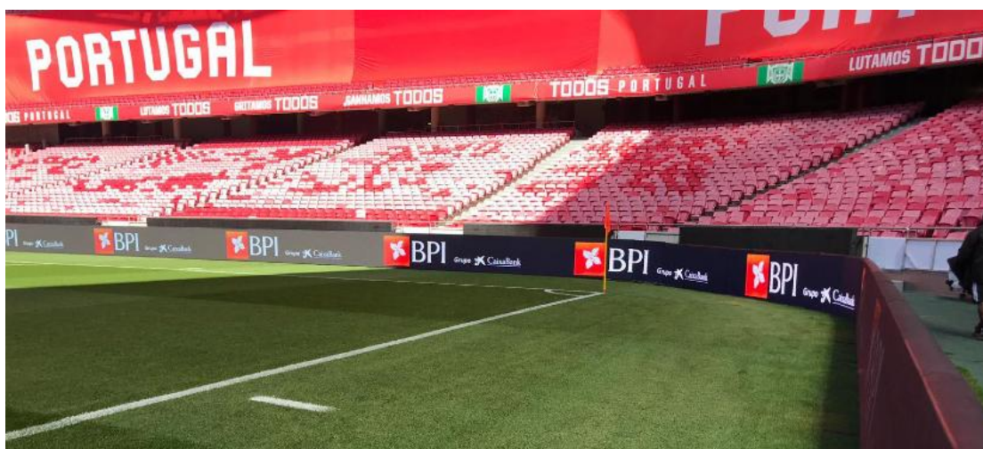
2020年欧洲杯预选赛项目

在体育显示领域，通过在行业内多年的人才储备、技术积累和市场拓展，“洲明体育”品牌影响力享誉全球。目前公司已配有专业的体育研发团队、市场调研团队、解决方案团队及售后支持团队，并为客户提供精准匹配符合各应用场馆及客户需求的体育应用解决方案。报告期内，公司助力 2020 年欧洲杯预选赛，为其提供专业的体育显示应用产品及解决方案。